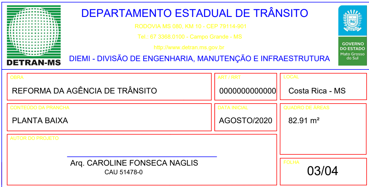
PLANTA BAIXA ESC. 1/75