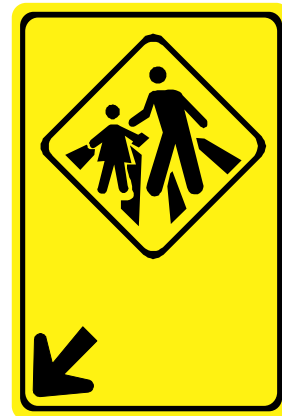
A - 33b Passagem sinalizada de escolares