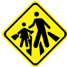
A - 33b Passagem sinalizada de escolares