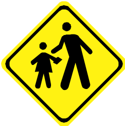
A - 33a Área escolar