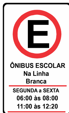
R - 6b Estacionamento Regulamentado