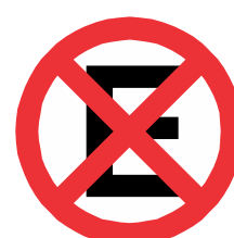
R - 6c Proibido parar e estacionar