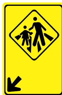
A - 33b Passagem sinalizada de escolares