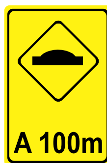
A - 18 Saliência ou lombada