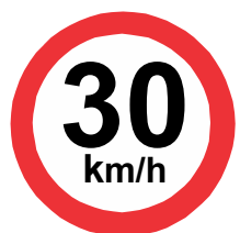
R - 19 Velocidade máxima permitida