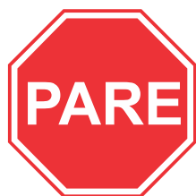
R - 1 Parada obrigatória