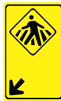
A - 32b Passagem sinalizada de pedestres