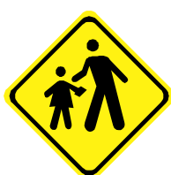
A - 33a Área Escolar