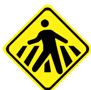
A - 32b Passagem sinalizada de pedestres