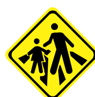
A - 33b Passagem sinalizada de escolares