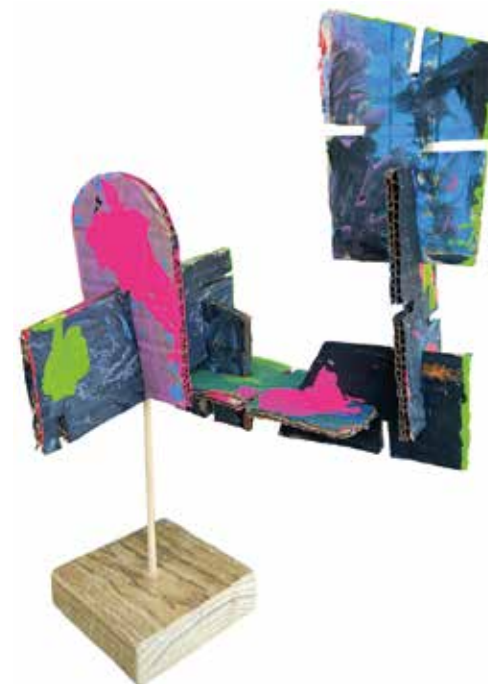
Ateliê de Artes