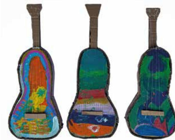
Ateliê de Música