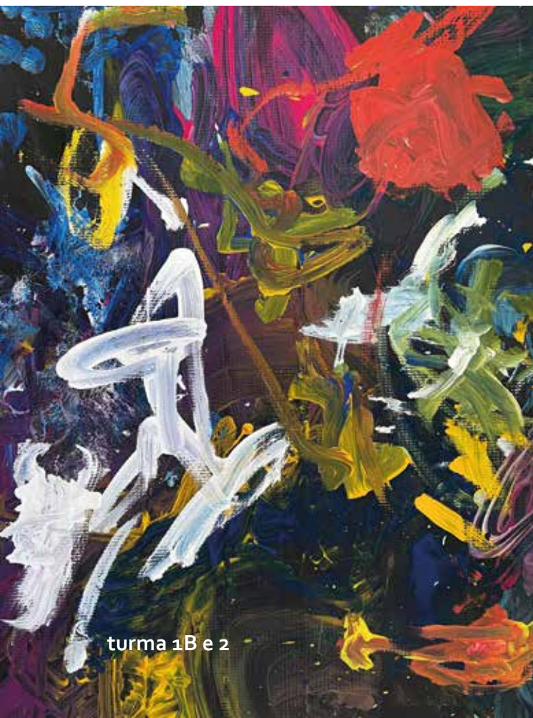
turma 1B e 2

Inspiradas em sua técnica de ação e expressão livre, experimentaram novas formas de criar e refletiram sobre a relação entre arte e sustentabilidade. As telas utilizadas, que seriam descartadas, chegaram por meio de doações e foram ressignificadas como suportes para novas produções. O resultado é uma coleção de obras vibrantes que revelam a potência criativa das crianças e reforçam a importância de reaproveitar materiais e cuidar do planeta.